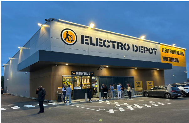
Site de Varennes-sur-Seine